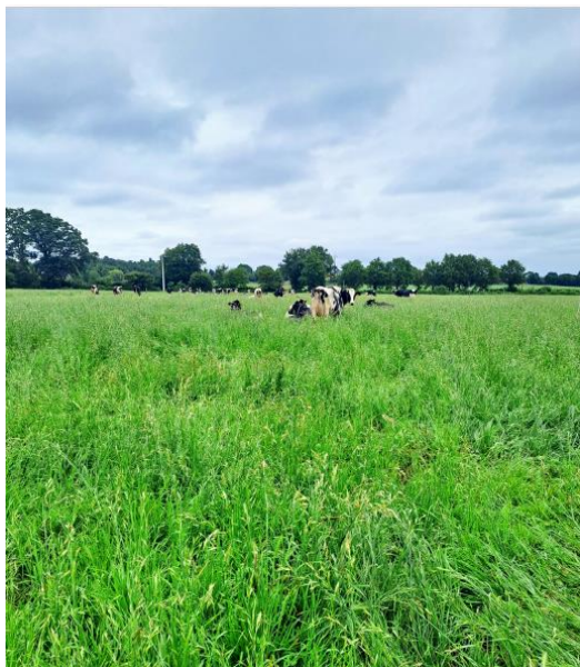
exemple d'un paddock non fauché avant pâturage